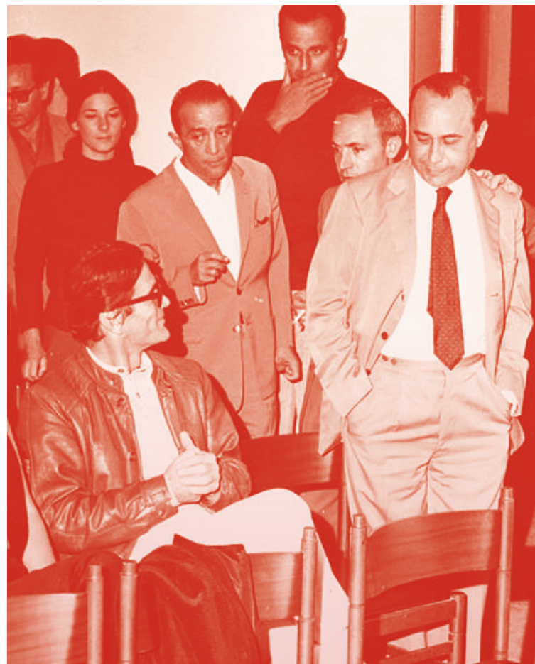
In copertina: Sciascia e Pasolini - Premio Brancati, 1988

Affinità e differenze tra due intellettuali soli e disorganici, "fraterni e lontani"